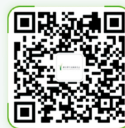
騰訊青年發展委員會